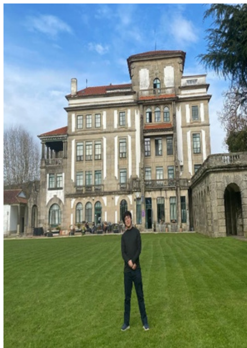
Foto: Estudiante de la ECA C-VII

21. Qué consejo le darías a otros estudiantes que estén considerando hacer una movilidad internacional Asegurarse de contar con recursos económicos, ya que la beca podría no cubrir todo. Estar preparados para la sensación de aislamiento y la necesidad de adaptarse a nuevas ideologías. Tener en cuenta las diferencias en la comida y la forma de socializar en el nuevo país.