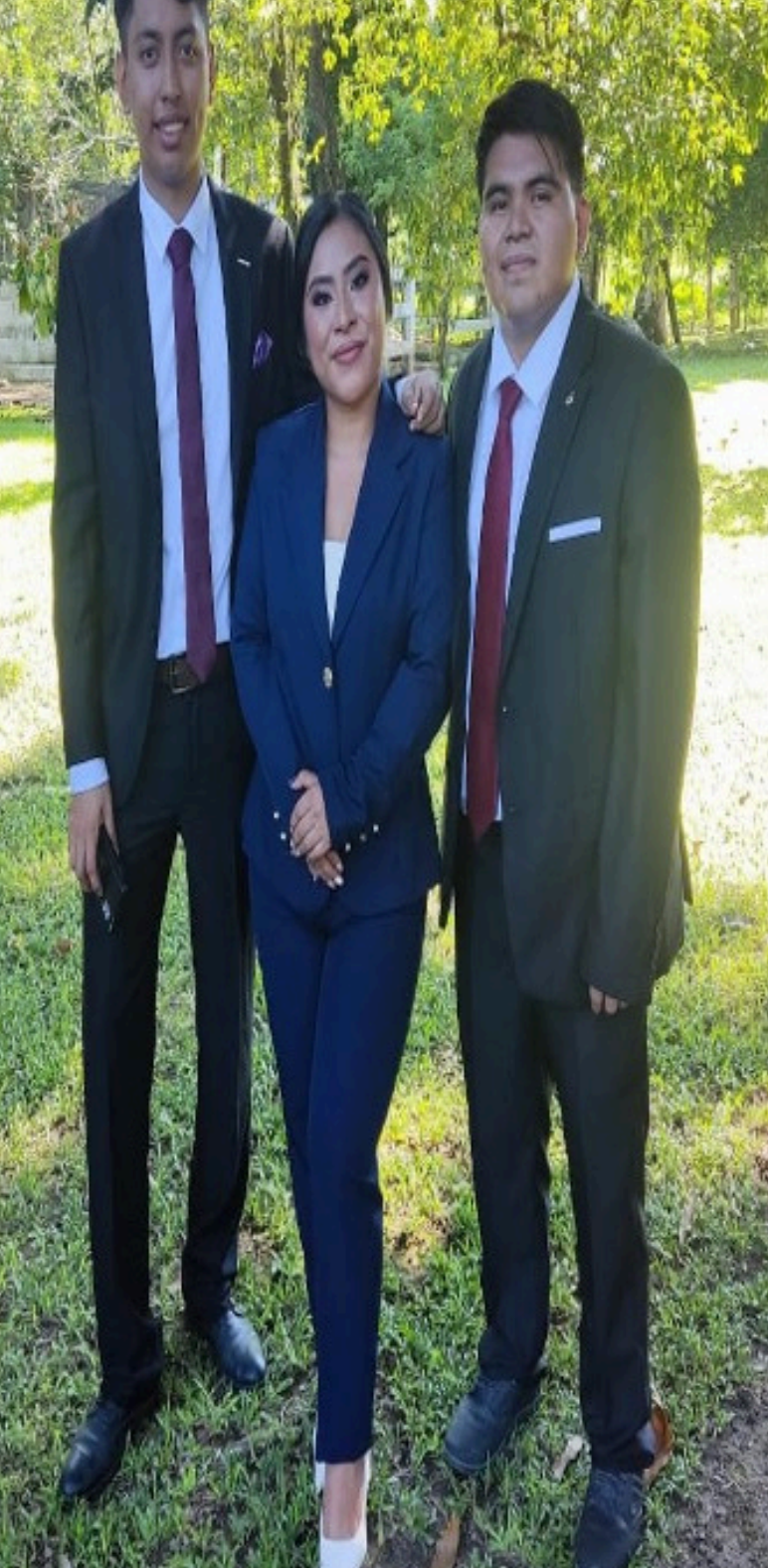
Foto: Estudiantes de la ECA C-VII