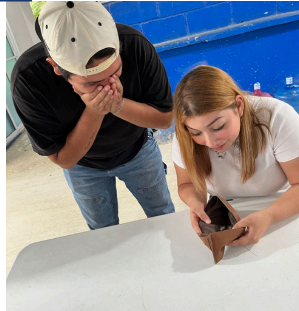
Foto: Estudiantes de la ECA C-VII

Estos esquemas son temporales y recorren todas las regiones de los diferentes países con el objetivo de timar a las personas que son engañadas en participar. Es cierto, los primeros inversionistas logran obtener su inversión de vuelta y alguna ganancias pero quienes invierten posteriormente son totalmente engañados y “robados”. Se tienen registros de estos esquemas piramidales en varios países de Sudamérica como Chile, Colombia y Argentina entre otros. En Argentina, inclusive se vio involucrado el propio presidente de esa nación, Javier Milei quién hizo promoción a uno de esos esquemas, con la posterior presentación de demandas ciudadanas en su contra por las personas defraudadas. En México, se tiene registro de estas “estafas” en estados como Jalisco, Nuevo León y Puebla.